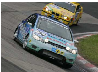
神通 邦彦 【専門領域】エンジン設計

研究所ではV6・V10エンジンの設計を担当。 また、自己啓発でシビックハイブリッドによるレース活動にも参加し、車体電装設計も経験。 幅広い知識を学生達に伝えます。