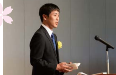
木ノ内さん 在校生代表「歓迎の言葉」