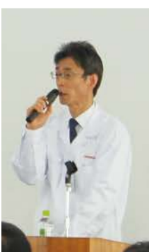
貝原執行役員「講話」