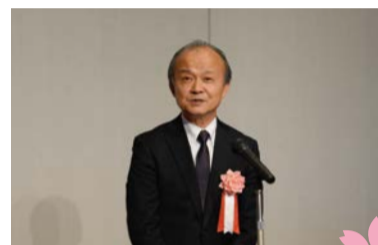
株式会社モビリティランド 山下社長「祝辞」